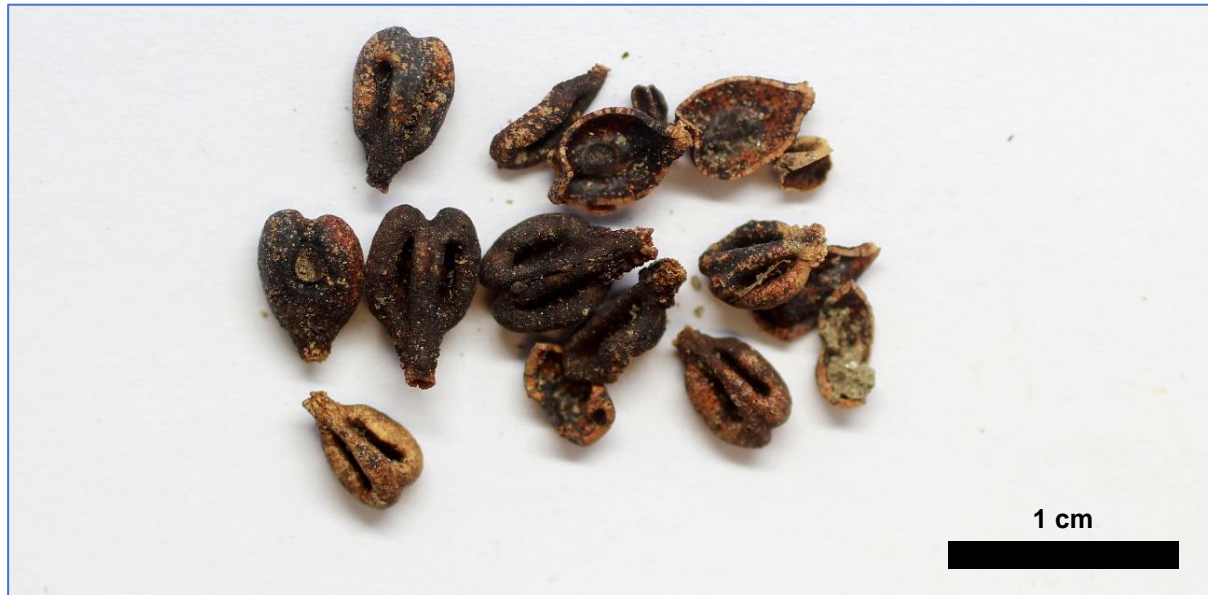
Figura 1: Semillas de uva recuperadas em contexto arqueológico na periferia da cidade de Braga, ©JAUM.

Resumen: El estudio arqueológico de las plantas es una poderosa herramienta para desentrañar los hábitos de las sociedades humanas del pasado y su intervención en el paisaje y el medio ambiente. De hecho, la biología vegetal desempeña un papel importante a la hora de proporcionar herramientas y conceptos para analizar la ecología del paisaje rural, incluida la composición de la vegetación, las pautas de uso del suelo, la biodiversidad y el modo en que las actividades humanas han impactado en los ecosistemas locales. Por ejemplo, la identificación de especies vegetales o semillas puede proporcionar información valiosa sobre los hábitos alimentarios, las variedades específicas utilizadas, así como los hábitos de intercambio cultural y comercial. En este contexto, se debatirá, por ejemplo, cómo las herramientas de análisis morfológico de semillas y otros tejidos vegetales, así como las técnicas de códigos de barras genéticos, permiten la identificación de especies. En conjunto, la información combinada ayuda a construir una imagen más completa de la historia de los tiempos modernos y contemporáneos y de la relación de las antiguas sociedades humanas con el entorno natural.