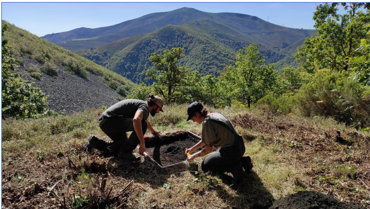
Figura 4: Labores de muestreo en una carbonera de cronología moderna en Ayande (Asturias, España).

Resumo: Longe das visões clássicas de paisagens estáticas, as zonas montanhosas do oeste asturiano revelaram um grande dinamismo durante os séculos pós-medievais. A formação de novos assentamentos ou a estabilização de assentamentos temporários, a expansão das parcelas e a apropriação de espaços comunitários, as mudanças na gestão florestal... são alguns dos efeitos mais visíveis das profundas mudanças deste período. A nossa investigação examina as evidências materiais destes processos com uma abordagem microanalítica, através da observação detalhada de pequenos territórios onde se desenvolvem todos os usos de uma dada comunidade rural. Trata-se de uma análise multidisciplinar de vários domínios, desenvolvendo um diálogo estreito entre a arqueologia, a história, a etnografia e as ciências do ambiente. O objetivo é traçar as relações entre as mudanças nas práticas de gestão dos recursos naturais (pastagens, madeira, lenha, água, etc.), os direitos de acesso a esses recursos e as mudanças nas estruturas de povoamento. O objetivo final é verificar e avaliar em que medida as mudanças técnicas e jurídicas na gestão dos recursos naturais podem ter influenciado as transformações dos povoados desde o século XVI até aos processos de despovoamento mais recentes. Neste artigo apresentaremos a metodologia aplicada e os primeiros resultados do trabalho efetuado em La Puela e Fonteta (Ayande, Asturias).