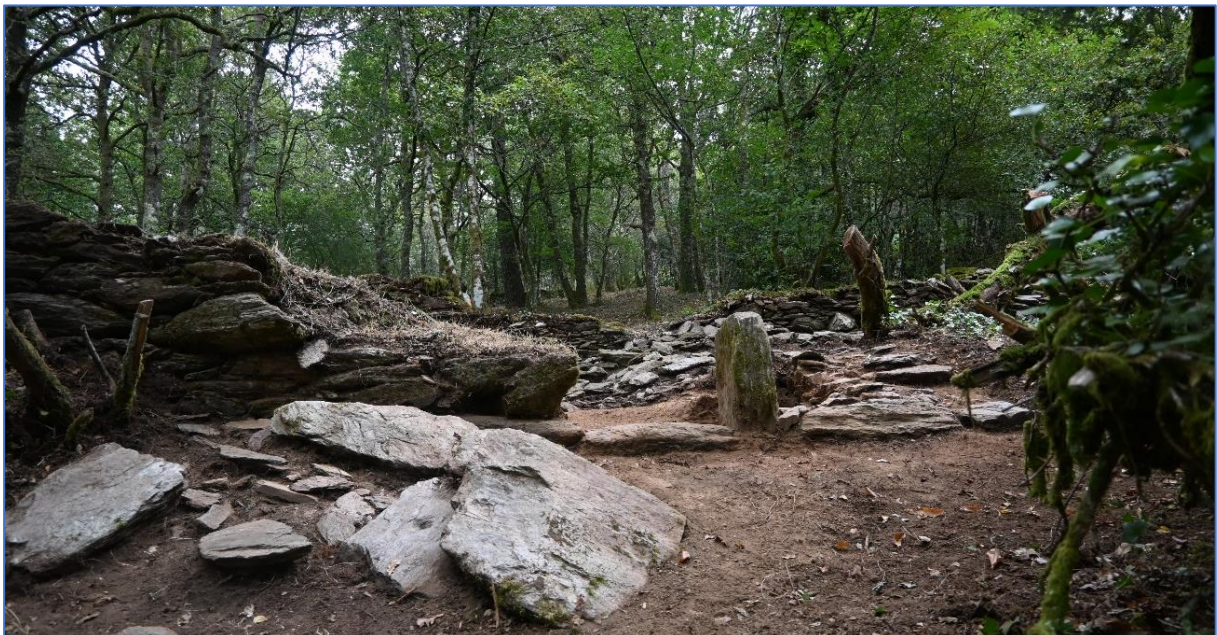
Figura 9: Excavaciones en la aldea de Silvaescura (Forcarei, Pontevedra, España).

Resumo: Entre as árbores do bosque de Silvaescura (Forcarei, Pontevedra, Galiza) encontrám-se os restos de antigas paredes de pedra, a que os habitantes locais chamam "paredes vellas". Em agosto de 2022, uma equipa do INCIPIIT-CSIC iniciou um projeto arqueológico nesta zona, com o objetivo principal de verificar se estas ruínas poderiam ser os restos da aldeia de Silvaescura. Esta aldeia é mencionada em documentos históricos de meados do século XVII, a propósito do tributo que tinha de ser pago ao mosteiro de Aciveiro, centro do poder na região de Terra de Montes desde o século XII. Assim, o nosso projeto estuda a paisagem do lugar de Silvaescura, formada por socalcos, recintos de pedra, caminhos, pontes e moinhos. Especificamente, foram efectuadas escavações arqueológicas nas ruínas das três estruturas domésticas sobreviventes, bem como na área circundante. Nesta apresentação apresentaremos os resultados das duas campanhas realizadas até ao momento, sendo as principais conclusões: (i) que estas estruturas funcionaram como espaços domésticos (pelo menos em algumas das suas fases), pelo que é provável que se trate efetivamente dos vestígios do povoado de Silvaescura e (ii) que este povoado foi ocupado pelo menos desde o início do século XVII até ao final do século XIX. No entanto, há uma série de questões a que esperamos dar resposta em futuras campanhas.