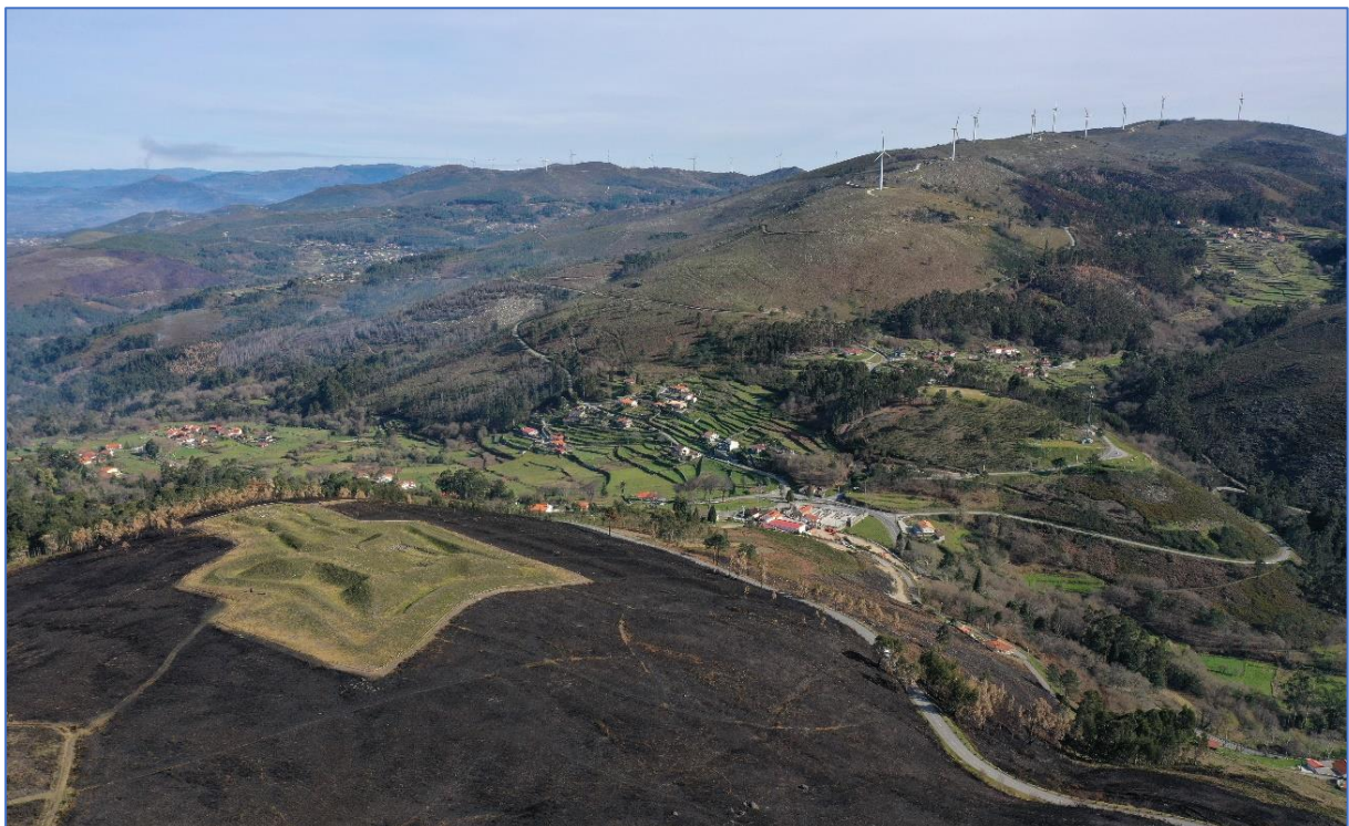
Figura 6: Paisagem de Extremo com o Forte de Bragandelo em primeiro plano, ©Jose M. Costa-García, 2022.

Resumen: Desde una perspectiva arqueológica y patrimonial, el paisaje es un producto, una conceptualización que nos permite leer y comprender las acciones que las comunidades realizan en el territorio que habitan y usan a lo largo del tiempo. En este sentido, el paisaje es a la vez una acumulación de esas acciones, la coordenada espacial en donde seguimos desarrollando nuestra actividad, y un legado a futuro. Si tenemos en cuenta la primera de estas condiciones, el paisaje se considera un documento clave para entender las sociedades humanas: sus patrones de ocupación del espacio, sus formas de vida, la circulación, el aprovechamiento de los recursos. Como documento nos puede informar tanto de lo que pasó en un tiempo concreto, como de las transformaciones posteriores de las huellas dejadas por cada comunidad. En la freguesia de Portela-Extremo (Arcos de Valdevez) conviven en la actualidad elementos de la prehistoria reciente, con fortificaciones de la Edad Moderna o un sistema agro-pastoril que está en proceso de degradación como consecuencia del abandono de las prácticas tradicionales asociadas a la emigración, la despoblación o en envejecimiento poblacional. Desde el proyecto PIPA FronteirA-S 2022-2025 (CSP 238751) y el Projeto Exploratório 2023/2024 del IN2PAST Land-CST (Ref. EXPL/In2Past/2023/09 – IP: Rebeca Blanco-Rotea), estamos desarrollando una metodología para leer estratigráficamente este paisaje. A su presentación y discusión se destina esta charla.