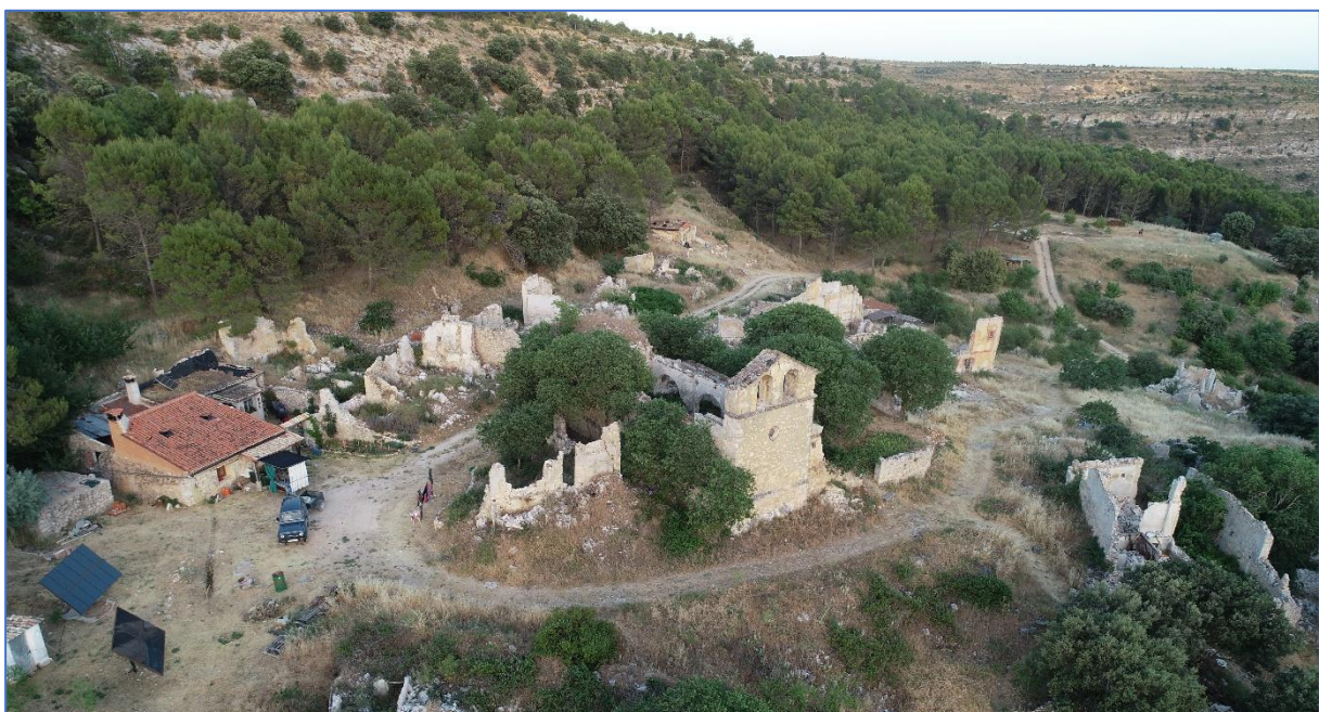
Figura 8: Hontanillas (Guadalajara, España).