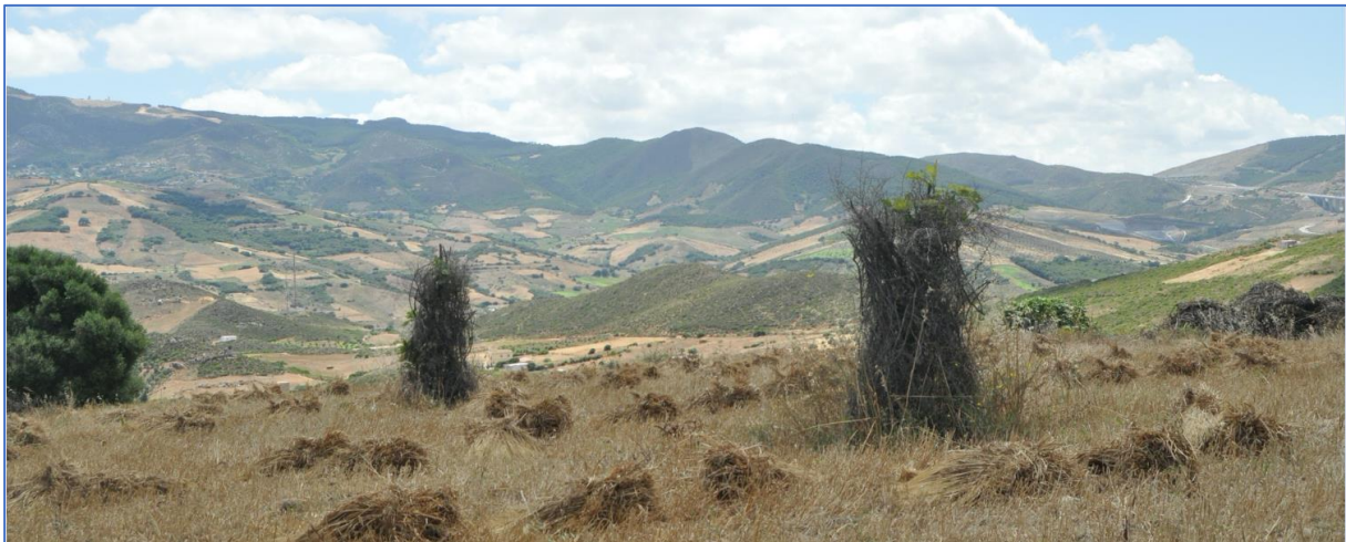
Figura 3: Perspetiva da paisagem de Fahs-Anjra a partir do sítio arqueológico de Benambroz, Norte de Marrocos.

Resumen: El objetivo de esta presentación es resumir sintéticamente tres enfoques del estudio del paisaje, explicando los diferentes objetivos, metodologías y resultados. El primer enfoque se centra en el territorio en torno a la Braga romana y los mecanismos que ayudan a comprender su transformación bajo el efecto de la conquista y la presencia romana. El segundo se centra en los procesos de identificación y comprensión del paisaje en torno a la fortaleza portuguesa de Alcácer Ceguer, en el norte de Marruecos. Por último, discutiremos algunas perspectivas de investigación en la región de la Serra do Gerês, en particular en la zona atravesada por la calzada romana conocida como la Geira .