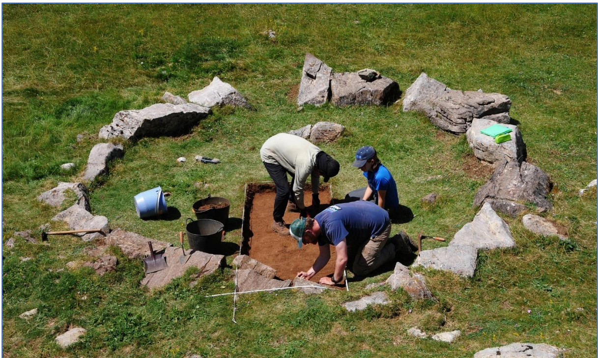
Figura 5: Excavaciones arqueológicas en una estructura pastoril durante la campaña arqueológica de 2020 en las Fuentes del Sil (Babia, León, España).