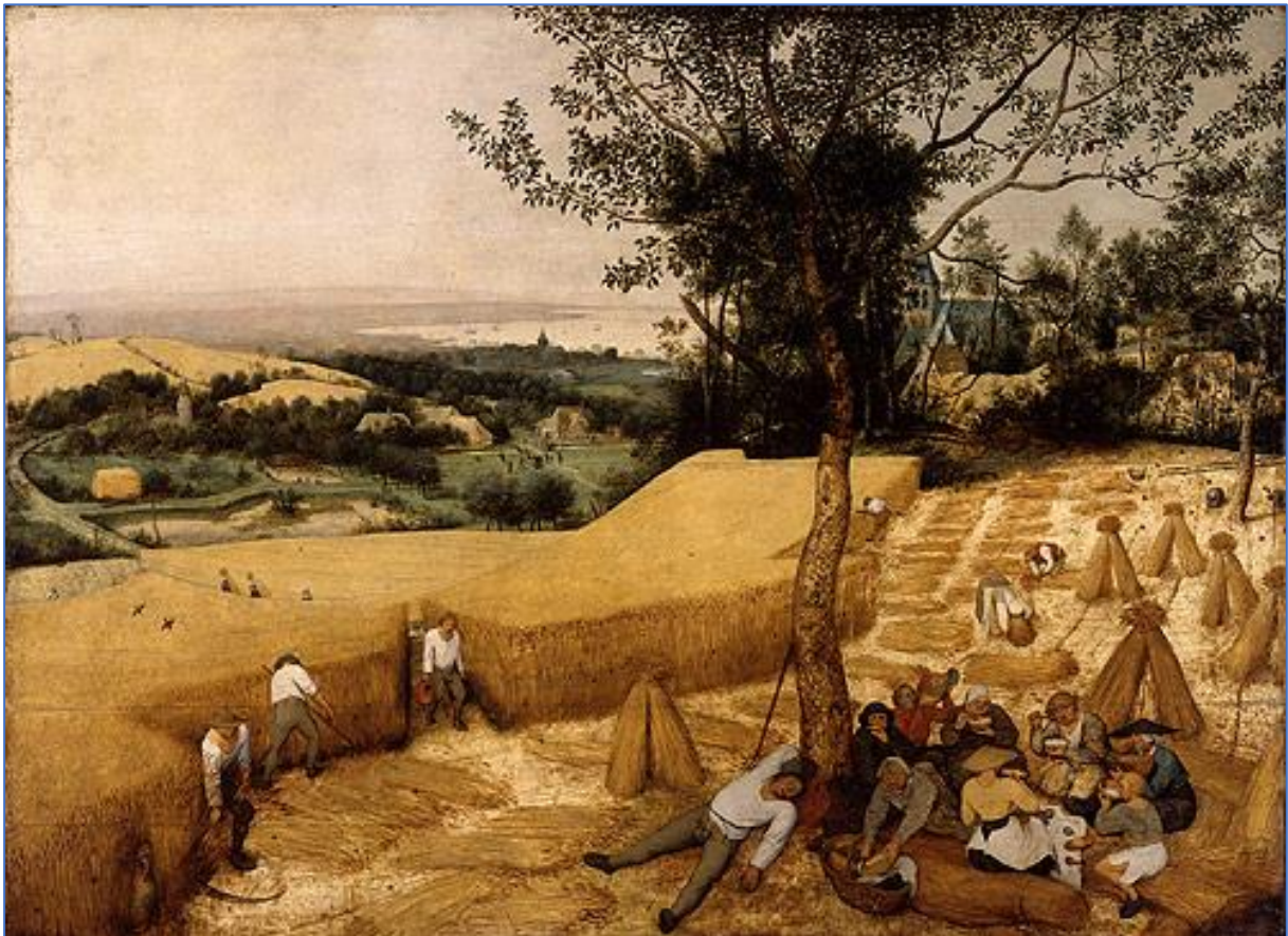
Figura 2: The Harvesters , Pieter Bruegel the Elder, 1565.

Resumen: El trabajo presentado forma parte del programa Erasmus+ KA220-HED Cooperation Partnerships in Higher Education denominado New Ruralities (NERU) llevado a cabo con diferentes escuelas de arquitectura europeas: Université Libre de Bruxelles (Bélgica), Universidade da Coruña (España), Universiteit Po Architectura Stroitelstvo i Geodezija (Bulgaria), Politecnico di Torino (Italia) y ETH Zurich (Suíza). Su interés común hace hincapié en la necesidad de observar los lugares que se han vuelto invisibles en el discurso arquitectónico, los lugares más o menos explotados o abandonados que forman parte de lo que llamamos "el rural". Además de estudiar las condiciones actuales, mostrar los conflictos y las transformaciones, es sobre todo importante preguntarse cuáles podrían ser las nuevas ruralidades y buscar formas de coexistencia entre la especificidad local y las dinámicas globales.